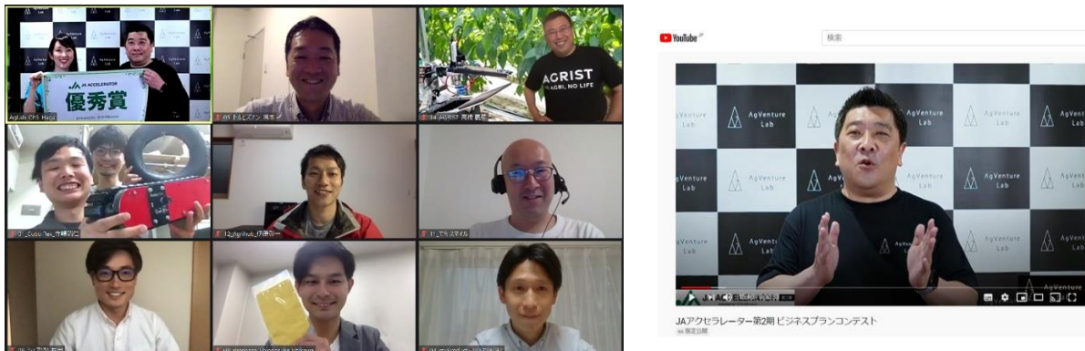
（左：本プログラムに採択された8企業の代表者の方々）

一般社団法人 AgVenture Lab（本社：東京都千代田区、代表理事理事長：荻野浩輝）は、農業、地域社会が抱える様々な課題解決を目指す「JAアクセラレータープログラム第2期」（以下「本プログラム」という。）に参加する企業を選抜するためのビジネスプランコンテストを5月18日オンライン配信で開催し、本プログラムに参加する8社を決定いたしました。今後、約5か月のプログラムの中で、AgVenture Lab、全国農業協同組合連合会、農林中央金庫をはじめとするJAグループにて各スタートアップ企業のビジネスの加速を支援していきます。