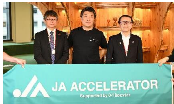
（左：本プログラムに採択された9企業の代表者の方々）