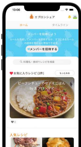
毎日悩む晩ご飯のメニュー