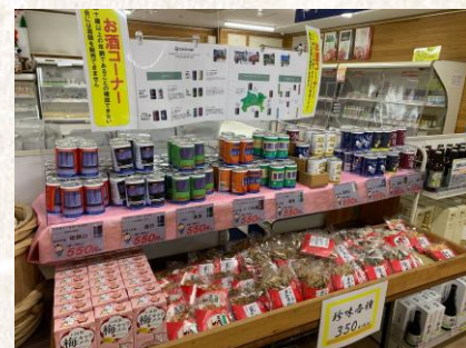
成田店での販売の様子