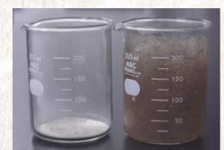
EF Polymer 100倍の水を入れた後のEF Polymer