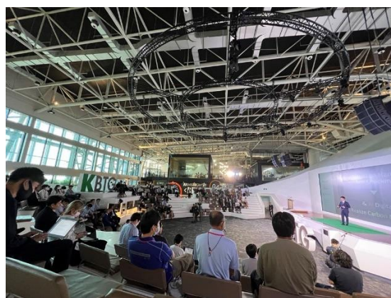
（左：登壇企業各社とイベント主催者の集合写真、右：会場の様子）

当イベントでは、日本のスタートアップ 8 社が登壇したほか、日本の食の魅力を訴求するため、株式会社魚力がタイ現地に設立した合弁会社 CP-Uoriki Co., Ltd の協力により、日本産鮮魚の寿司も提供されました。